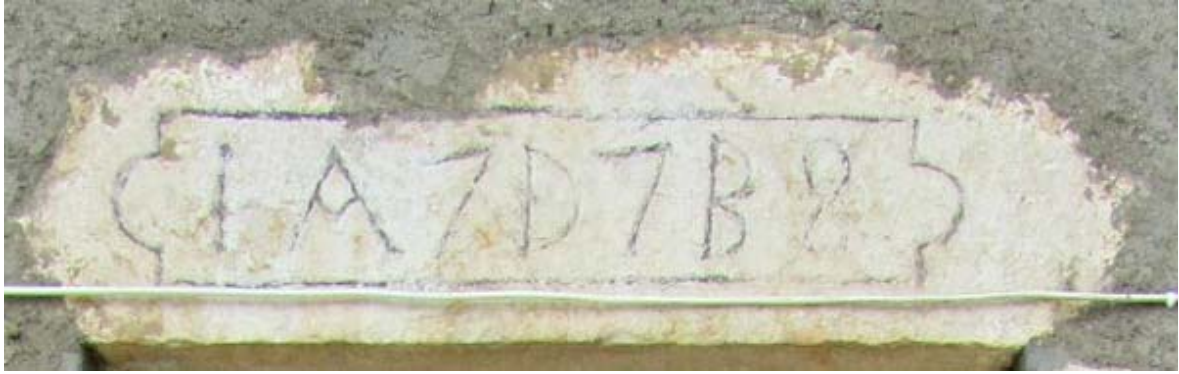
1778 pour une maison vraiment seigneuriale