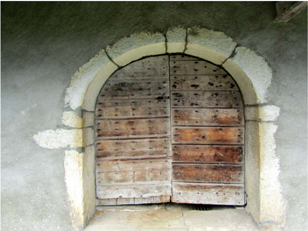
Des portes voûtées telles qu'on aime à les voir