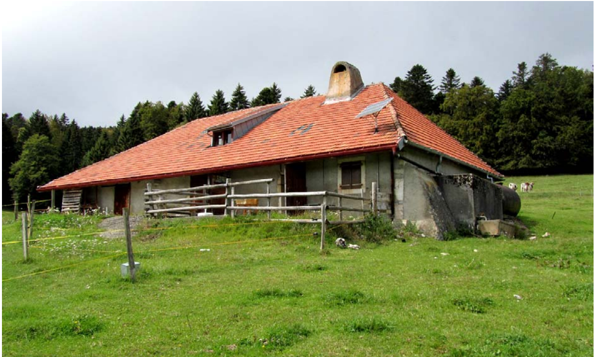
Toit de tuiles et cheminée typique de la région. Ci-dessous une porte qui ne laisse pas de nous interroger...