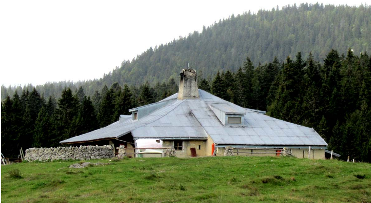
Les Pralets, immédiatement reconnaissable grâce à son toit particulier et d'une surface immense. Il y a ici buvette d'alpage. Elle était malheureusement fermée ce jour-là.