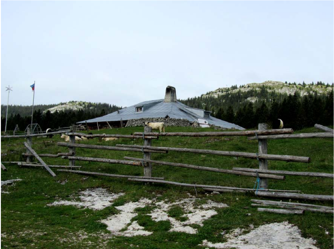
A l'arrière-plan, face à l'occident, les falaises du Mont-Salâ