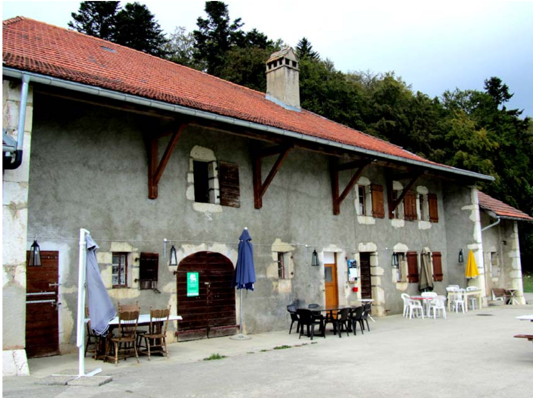
Buvette d'alpage, bien que nous soyons ici à moins de mille mètres. L'endroit vaut plus que le déplacement