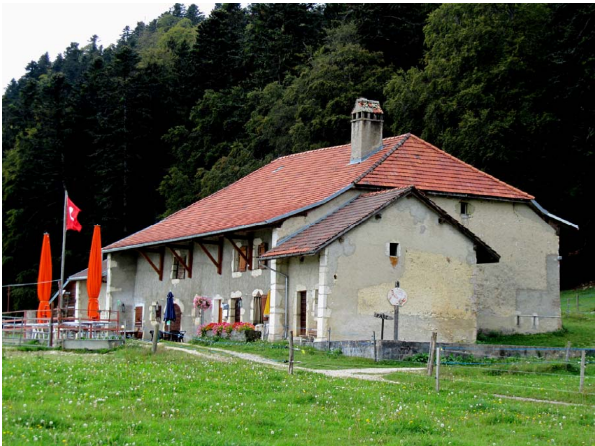
La Chaumette est une ferme vaudoise du XVIIIe siècle

La grande surprise du jour vint de la découverte de la Chaumette, ancienne ferme vaudoise située face à un pâturage – anciens champs labourables – d’une richesse exceptionnelle. Le tout, maison et territoire, constitue un patrimoine incroyable qu’une commune ne pourrait qu’avoir à cœur de garder dans son intégrité.