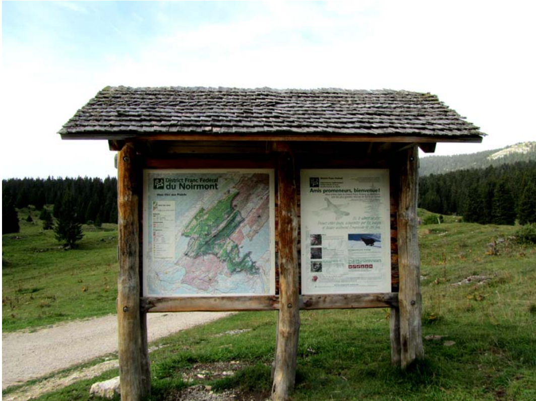
Un panneau vous expliquera ce que vous tenez à savoir sur la région