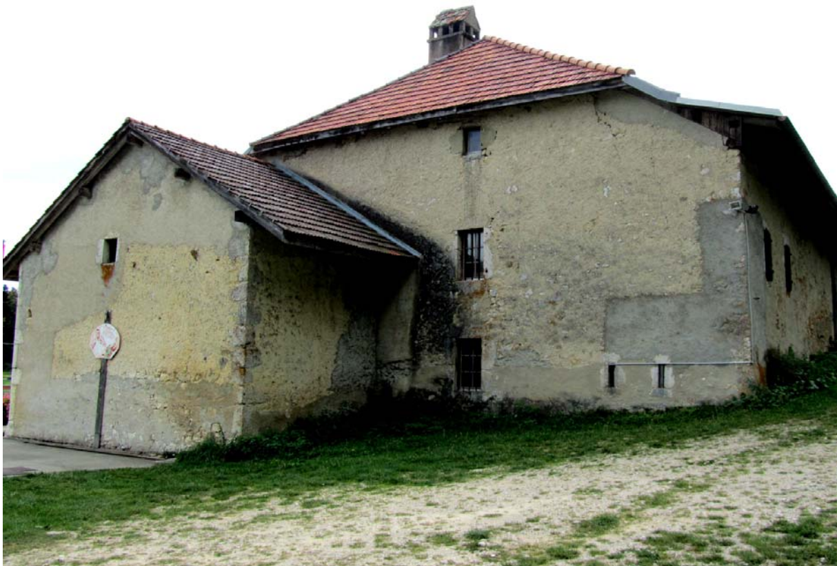
L'arrière moins avenant de cette impressionnante bâtisse.