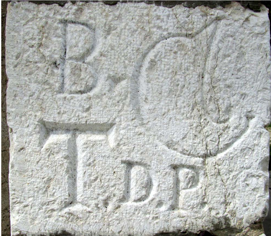
Mystère d'une inscription soigneusement faite dans l'une des pierres de taille