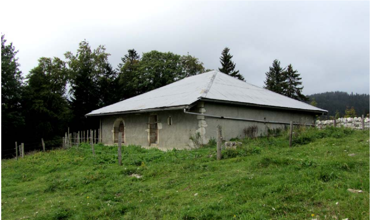
La Pessette, crépie lisse ! Avec deux portes magnifiquement encadrées de belles pierres de taille