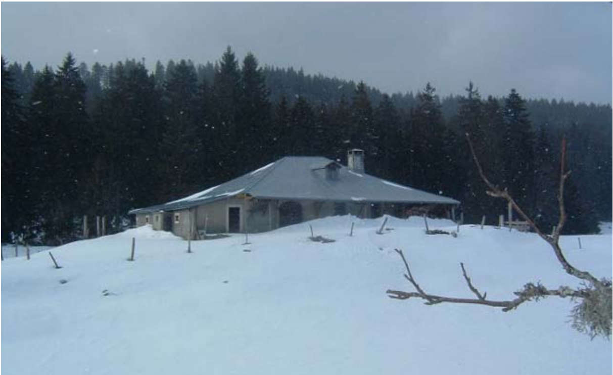
Les Frasses en 2010. Idem pour les deux photos de la page suivante.