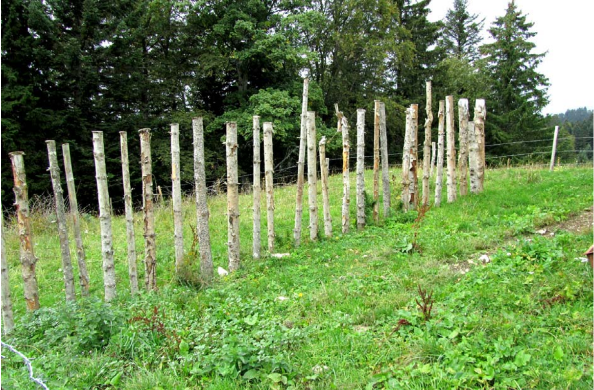
Ici l'on cultive. Mais quoi ?