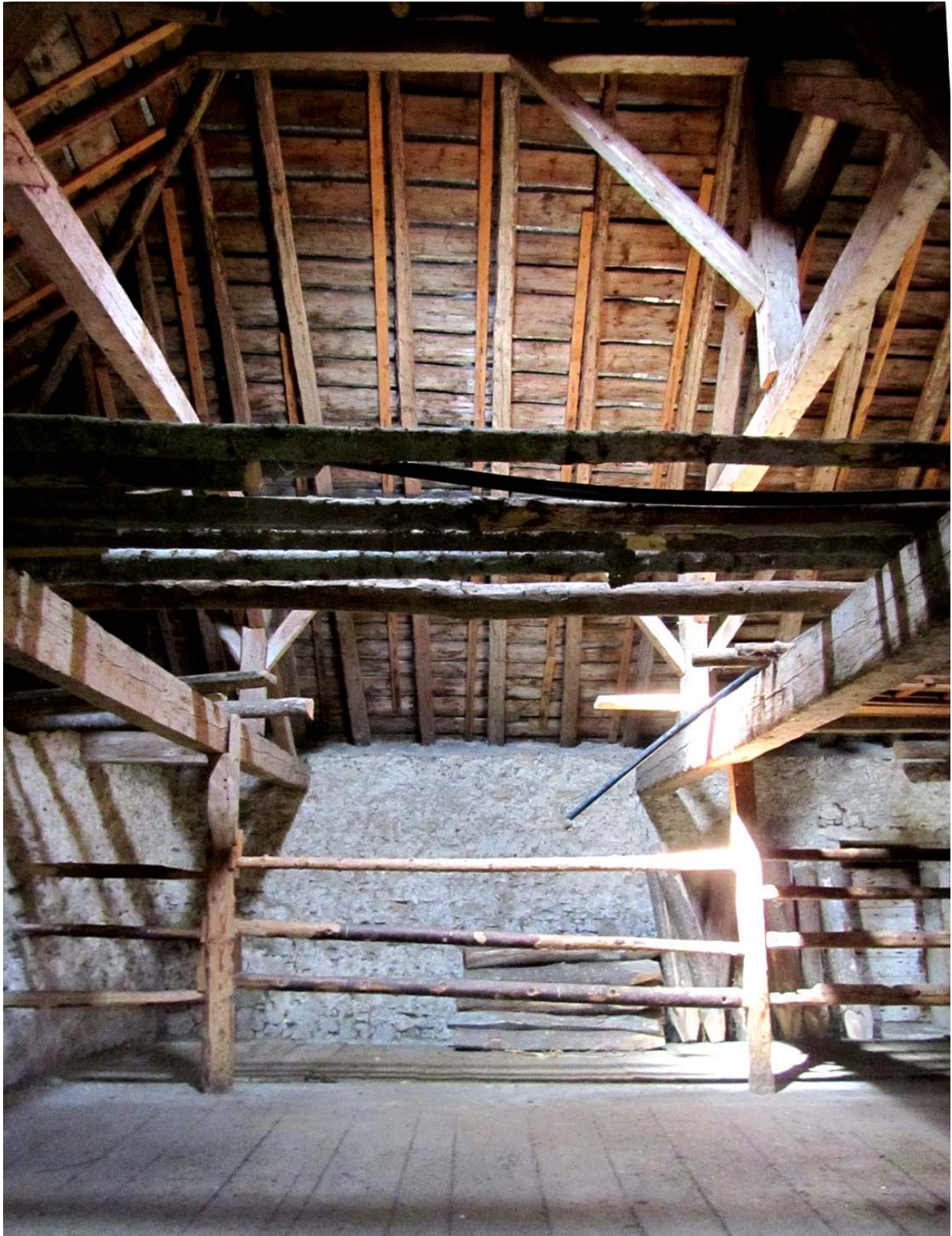
La belle charpente du Planet, et surtout, pour une fois, un intérieur parfaitement en ordre, sans le chenit ordinaire. Cela vous réchauffe le cœur !