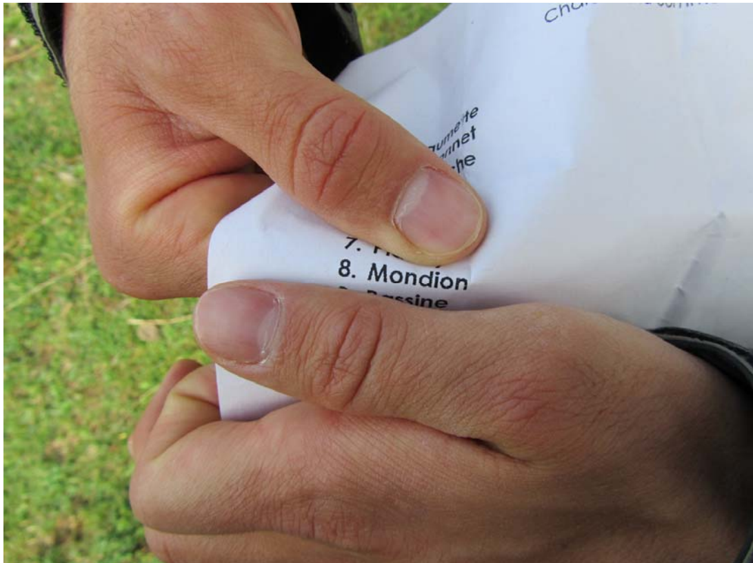
Autre manière de s'y retrouver !