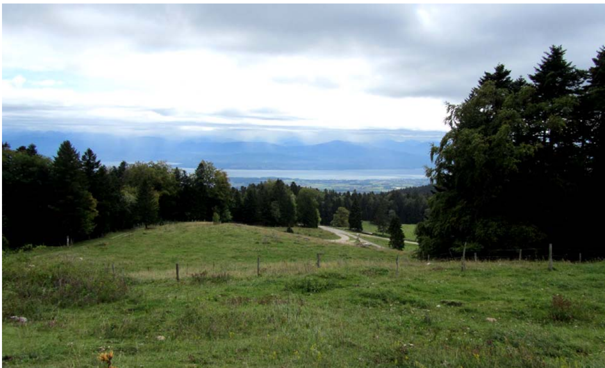
Vue superbe sur la plaine vaudoise et le Léman