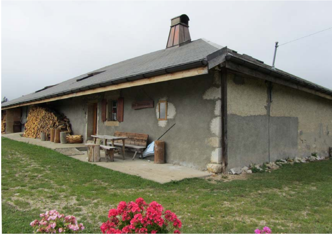
La Dunanche. Dommage que vous ne puissiez pas voir, face à cette jolie façade, l'impressionnante glissière d'auto-route solide pour durer mille ans !