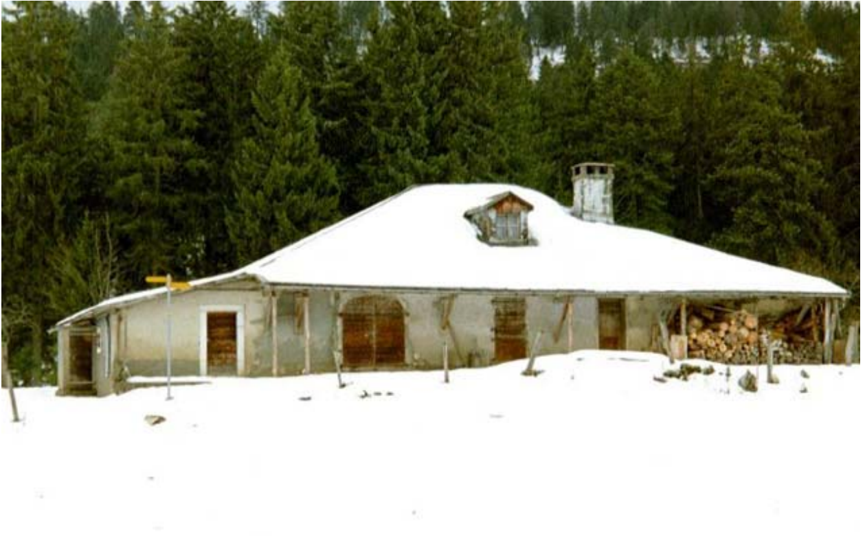
Les Frasses en 2001