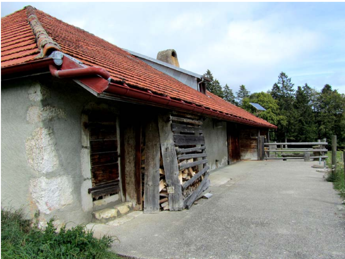
Nous sommes redescendus presque en plaine. Car si le Planet, par exemple était à 1344 m., le Bugnonet que voici n'est plus qu'à 995 m. Les pâturages proches, dont une partie en anciens champs, sont d'une richesse exceptionnelle. A labourer.