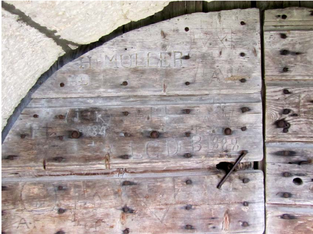
Ces portes où les bergers ont signalé leur passage par une inscription quelconque ou une date...