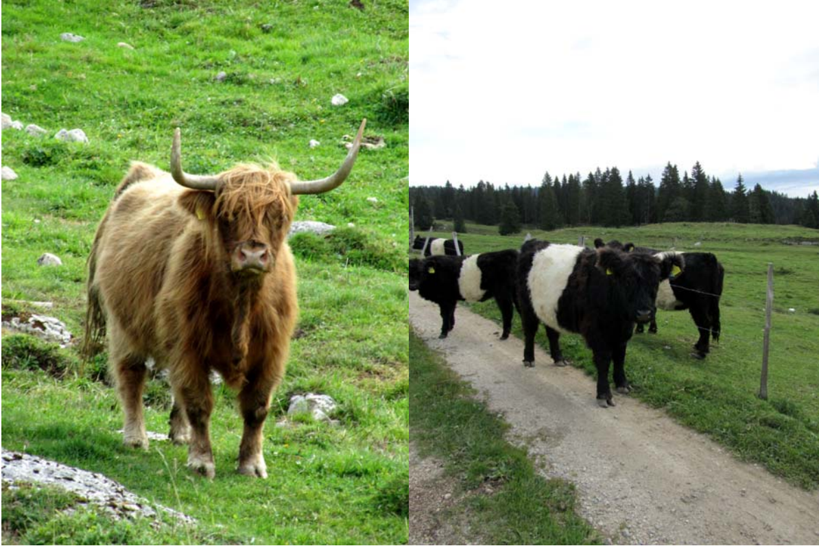
Les habitants du pâturage des Pralets. Mais où a donc passé notre bonne vieille simmental ?