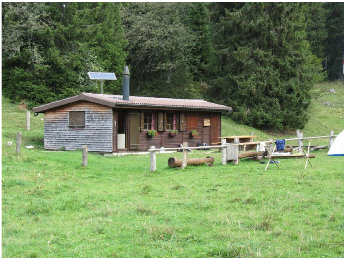
Une cabane, non loin du chemin principal