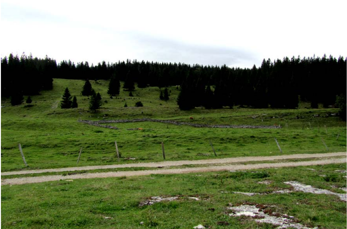
Au levant le traditionnel pré de fauche