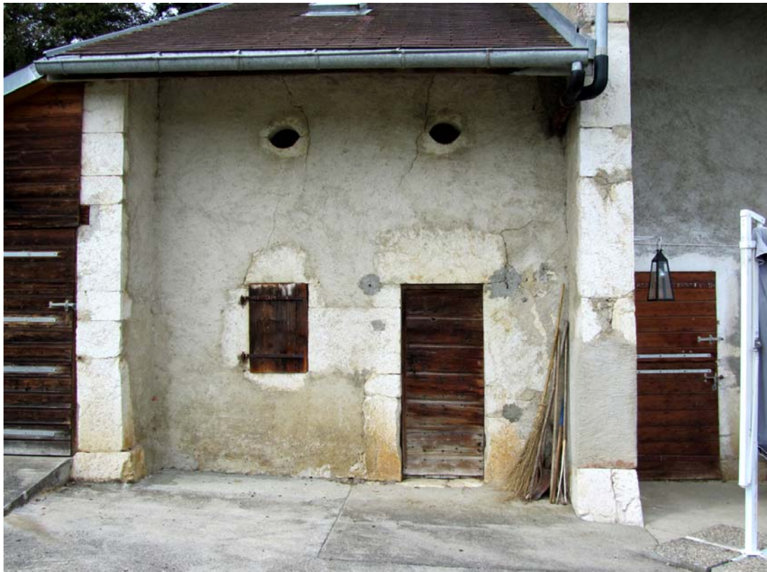
Annexe de gauche